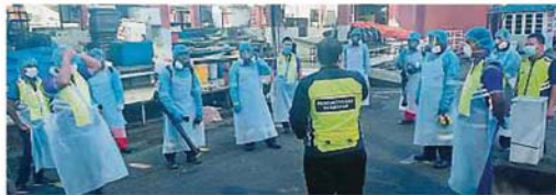
灵市政厅卫生组官员在旧区奧曼路巴剎前集合，准备进入巴剎清洁与消毒。

八打灵县有约20个巴剎，随着这两座巴剎出现小販确诊冠病和关闭巴剎后，巴剎内的高販也会在近期被安排进行冠病检测。