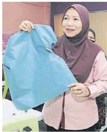
■ 诺莱妮展示志愿团队制作的医疗防护服。

至下午2时, 市议会的志愿团队分别在双威镇的3C体育馆及住家内赶工制作防护服, 每人每天能生产200套。