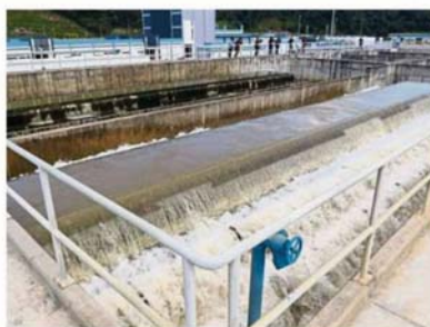
The Langat 2 water treatment plant. Past contamination of waterways had caused treatment plants to stop operations temporarily, causing disruption of water supply to consumers.

"A further check showed that the area was across state lines, in Negri Sembilan, and so Lembaga Urus Air Selangor (LUAS) contacted the Negri Sembilan Water Regulatory