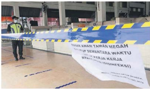
■巴刹已拉上警戒线，也有执法人员在一旁驻守，避免外人闯入。

Provided for client's internal research purposes only. May not be further copied, distributed, sold or published in any form without the prior consent of the copyright owner.