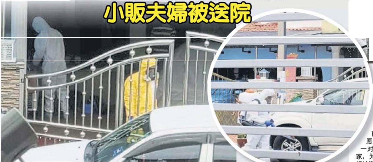
■ 医护团队也展开消毒工作。