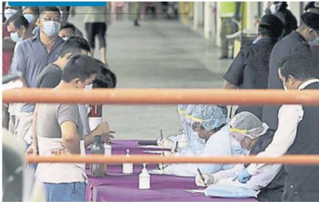
菜贩和员工一早排队登记等候检测。