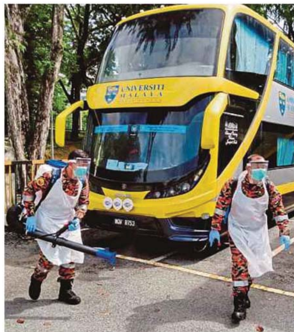
Fire and Rescue Department personnel sanitising a Universiti Malaya bus that will be used to transport students to their hometowns yesterday.

About 80 international students are staying at Unisel's Shah Alam and Bestari Jaya campuses, and all of them are provided with food.