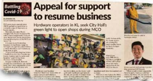
StarMetro's report on April 24.

For the record, the National Security Council (NSC) allows hardware shops to operate throughout the second phase of the MCO (April