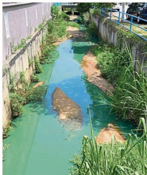
Green-coloured water detected in the drains near the HI-Tech 6 industrial area in Semenyih. The source of the pollution is believed to be from a printing factory.

The 24-hour surveillance at river basins will continue until May 31 in a joint effort with officers from various agencies — Indah Water Konsortium Sdn Bhd, Selangor Water Management Authority, Air Selangor, Selangor Environment Department, Selangor Disaster Management Unit, National Water Services Commission, the land office, local councils and police.