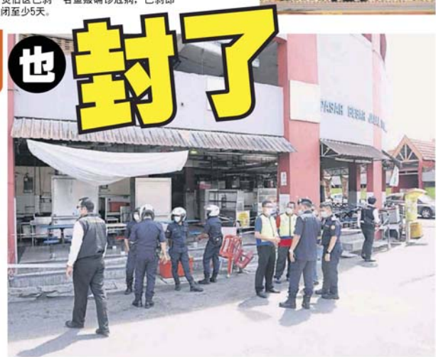
■警员在巴刹外面驻守，确保没有闲杂人等进入巴刹。