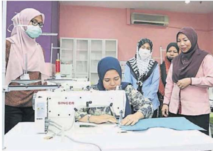
■ 志愿团队在双威镇的3C体育馆生产防护服。