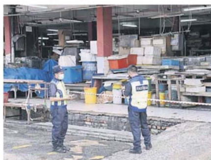
在后日早上9时进行，呼吁小贩给予配合，主动前来接受检测。”

他提及，旧区巴刹共有578个摊档，是今日起关闭；两座巴刹将至少关闭5天，从即日起生效。