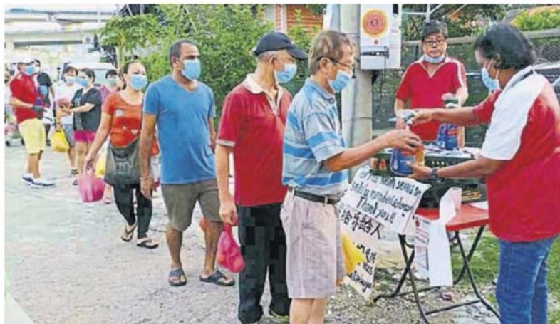
安邦巴刹商业小贩公会工作人员，派发白面包给巴刹顾客。

（安邦27日讯）安邦巴刹商业小贩公会日前分两天捐赠1500个口罩及700条新鲜白面包给巴刹顾客，以在目前的新冠肺炎（2019冠状病毒疾病）持续期间，尽一份社会责任。