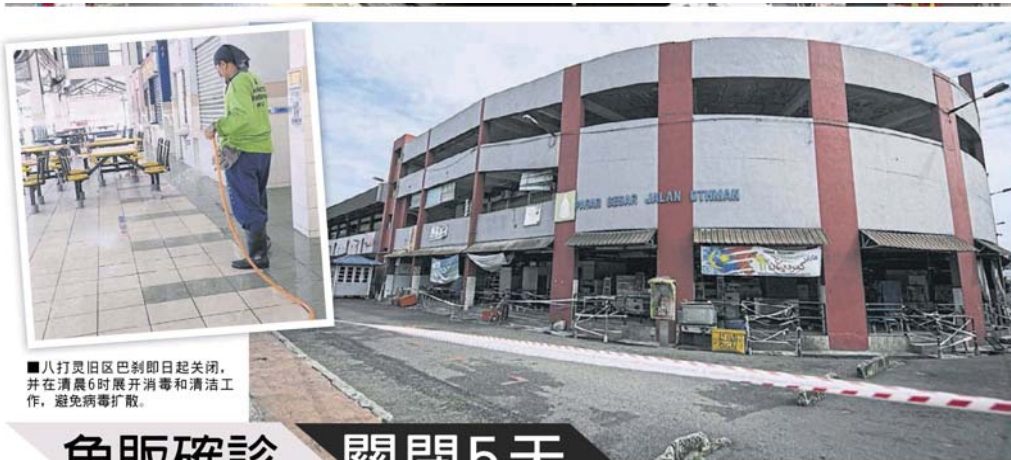
■八打灵旧区巴刹即日起关闭，并在清晨6时展开消毒和清洁工作，避免病毒扩散。

Provided for client's internal research purposes only. May not be further copied, distributed, sold or published in any form without the prior consent of the copyright owner.