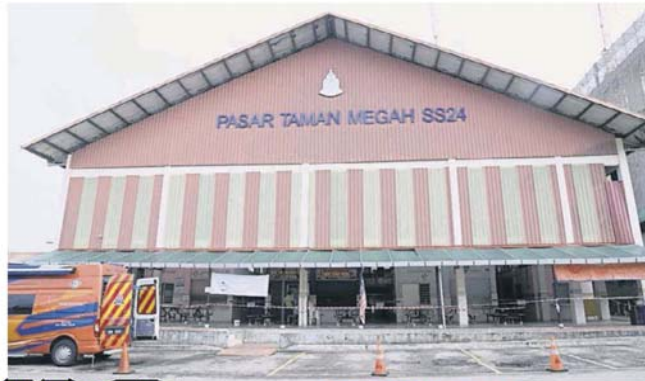
■灵市美嘉花园巴刹出现确诊病例，令周边居民倍感担忧，为了生计的商家只能硬着头皮冒险营业。