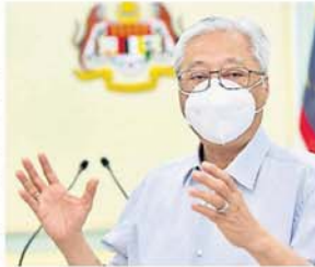
■依斯迈沙比利：政府将于5月1日后才决定，通过“Gerak Malaysia”应用程序申请回到城市工作的民众是否可以成行，以及什么时候才可以启程。

“相信军警方面会有解答民众疑惑的FAQ，请耐心等待，或许将会有新的SOP，现在没有新的SOP，但会于5月1日之后才提出讨论并决定新的SOP，到时才决定提出申请的民众可不可以回去，以及什么时候才可以