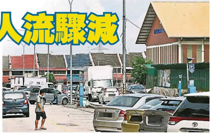
商家表示，美嘉花园商业区于星期一（27日）的人流量比往常减少许多，车辆也减少了。