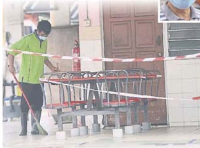
■所有小販都禁止营业，只剩下零星清洁工人，在巴刹范围内进行打扫工作。