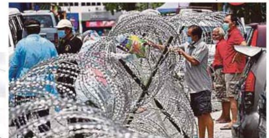
Petugas Jabatan Kebajikan Masyarakat mengagihkan barang keperluan harian kepada penduduk di Bandar Baru Selayang.