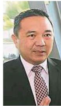
黄思汉:在齋戒月期间,雪州各地区的公共巴剎商贩一律不能营业超过下午2时。

他们说,实际上,政府允许小贩拉长两个小时做生意也帮不了多少,因为大部分小贩到了中午时分就陆续收档及回家休息了,至于会