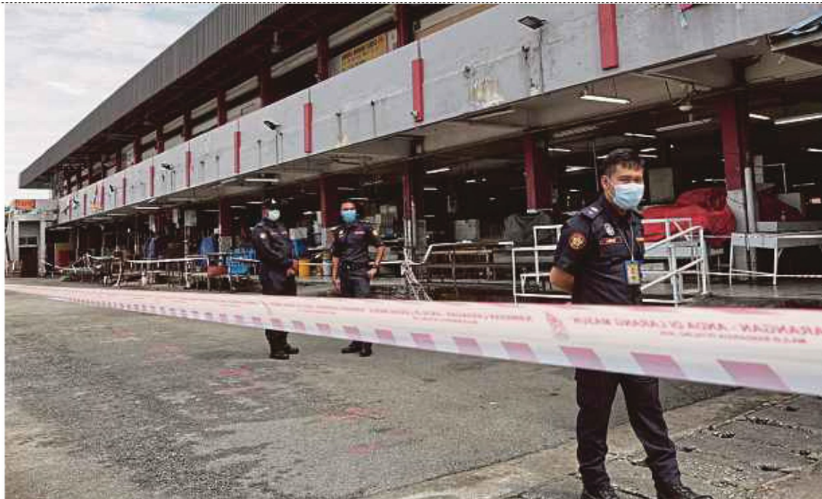
Petaling Jaya City Council enforcement officers patrolling the area after sealing off the PJ Old Town market yesterday.