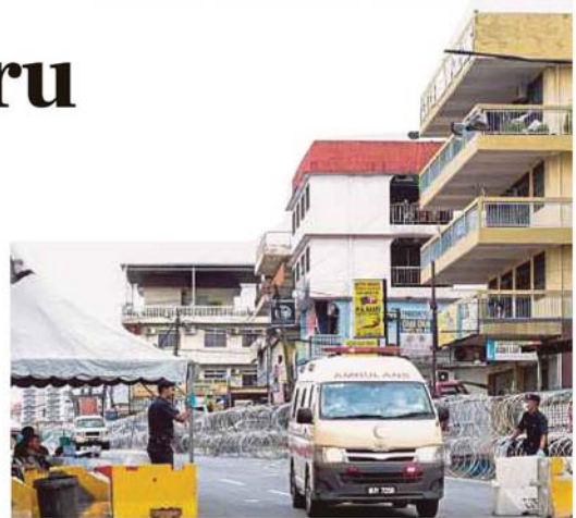
Kawasan sekitar Selayang Baru dipasang pagar kawat duri.

Bagi memastikan perintah berkenaan dilaksanakan, kawalan ketat dilakukan PDRM, ATM, Angkatan Pertahanan Awam Malaysia (APM), RELA serta Majlis Perbandaran Selayang (MPS).